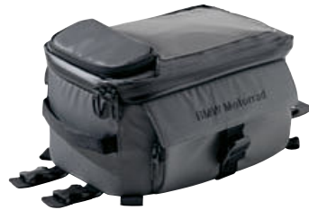
2 Tanktas klein