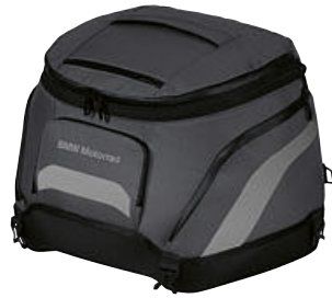
4 Softbag klein