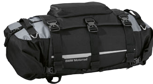
5 Bagagerol Atacama