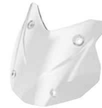
7 Windscherm laag getint