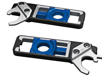
10 M kettingspanner met montagestandaardbevestiging