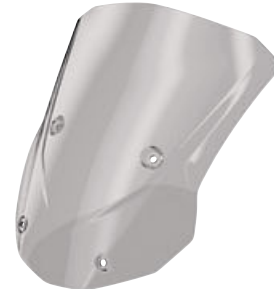
5 Windscherm hoog getint