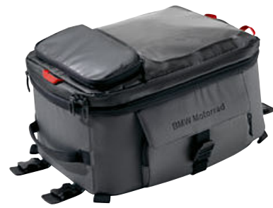
1 Tanktas groot