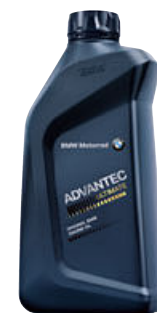
6 Original BMW Engine Oil ADVANTEC Ultimate 5W-40, 1 l