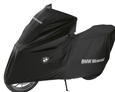
2 Beschermhoes Indoor