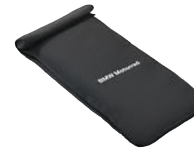
8 Tas voor smartphone