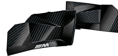
7 M carbon instrumentenpaneelbekleding