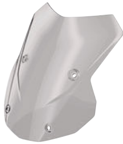
3 Windscherm getint