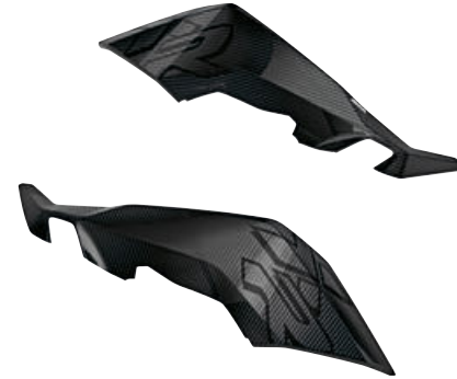
6 M carbon kuipzijdelen