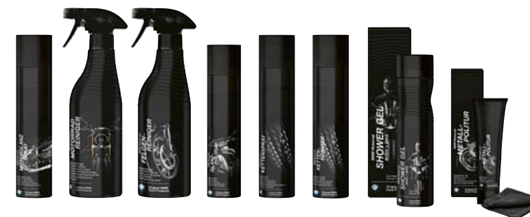
8 Original BMW Care Products