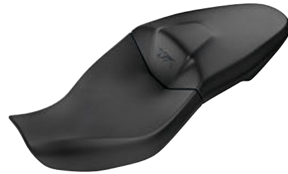
1 Buddyseat hoog