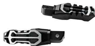
4 M voetsteunen voor passagier