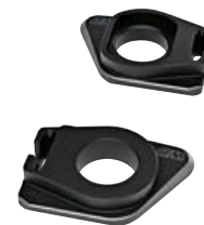
9 M kettingspanner