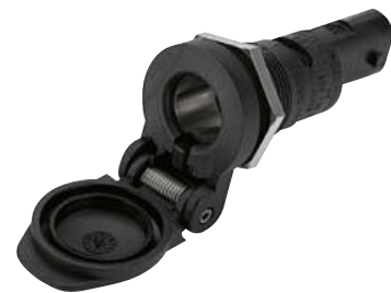
2 Uitbreidingsset extra contactdoos