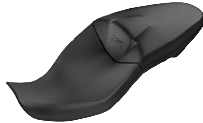
2 Buddyseat laag