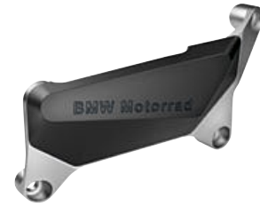
2 M motorprotector links