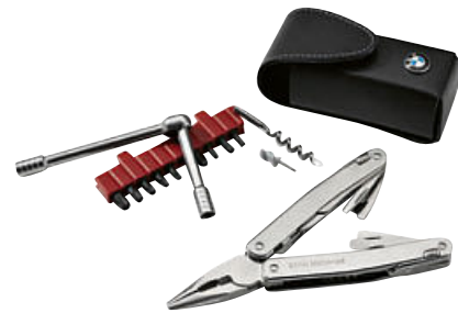
4 Multifunctioneel gereedschap