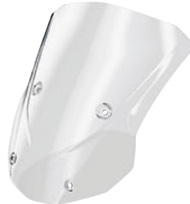
4 Kuipruit hoog