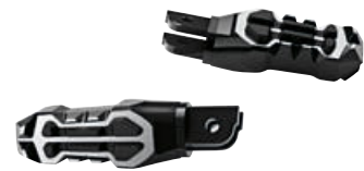
3 M voetsteunen voor berijder