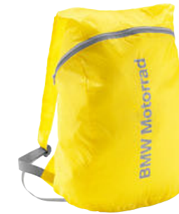
9 Opvouwbare rugzak