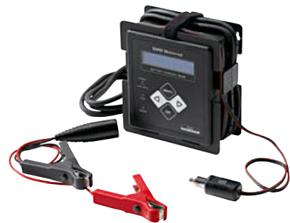
3 BMW Motorrad acculader Plus