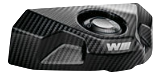
8 M carbon afdekking contactslot