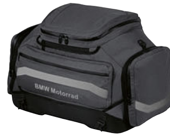
3 Softbag groot