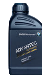
7 Original BMW Engine Oil ADVANTEC Ultimate 5W-40, 500 ml