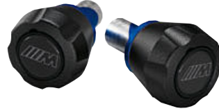
1 M asprotectoren